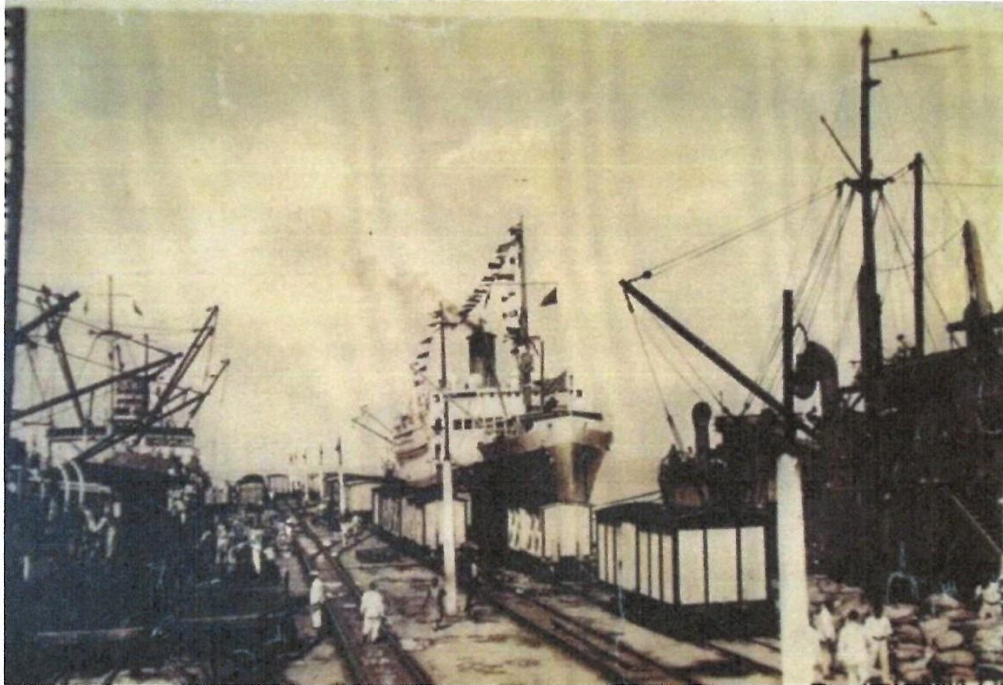
Imagen 4: Puerto de Puerto Colombia