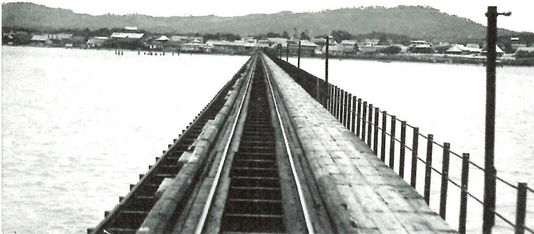
Imagen 3: Rieles del puerto