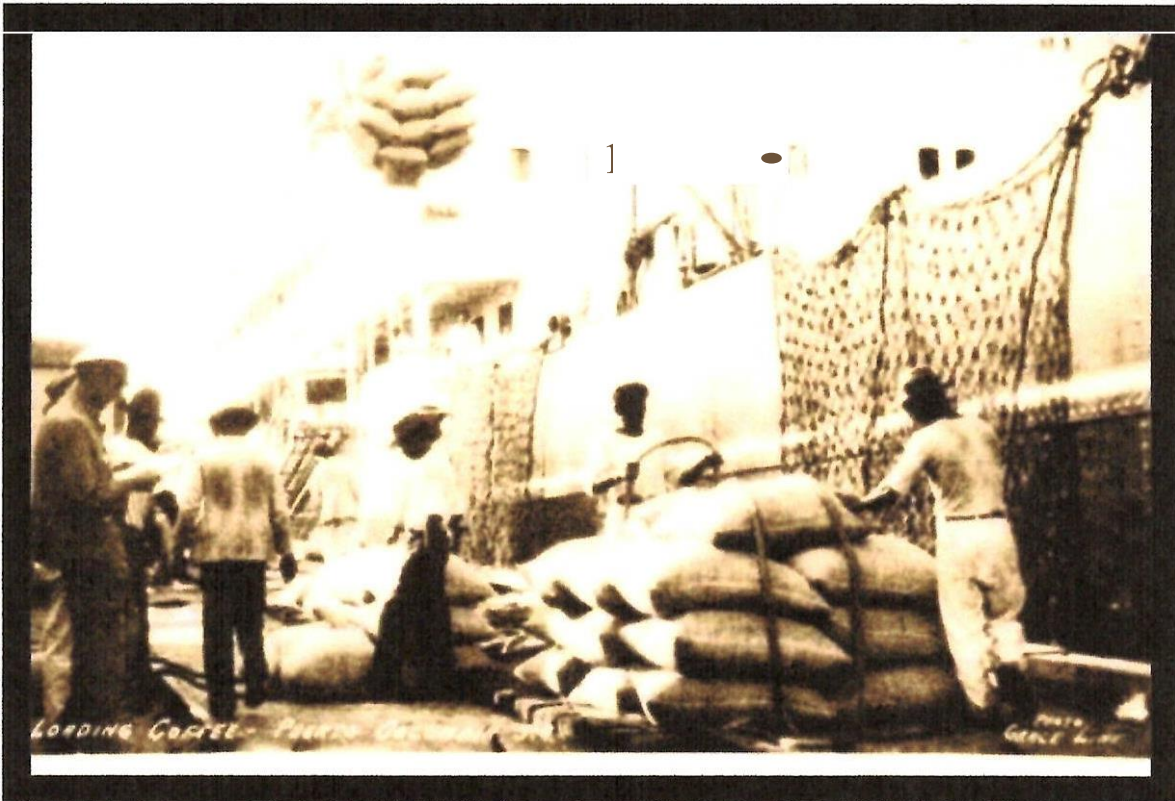
Imagen 2: Barcos descargando en el Puerto Colombia