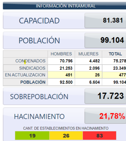
Gráfico estadístico de la información de la población intramural en el país. Recursos Extraídos de la página web del INPEC – Estadísticas. Recuperado en Línea 4